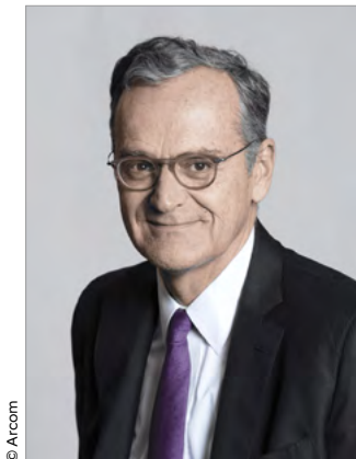
Roch-Olivier Maistre Président de l'Arcom

C'est un très grand plaisir pour l'Arcom de mobiliser pour la troisième édition consécutive les médias audiovisuels autour des acteurs, des valeurs et des réussites du parasport. L'opération « Jouons ensemble », lancée en 2021 à l'initiative du régulateur et à l'occasion de la retransmission des Jeux paralympiques de Tokyo, promeut une vision inclusive du sport auprès de tous les publics et contribue à une juste représentation du handicap sur les antennes.