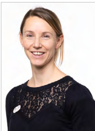
Marie-Amélie Le Fur Présidente du Comité Paralympique et Sportif Français

A moins d'un an des Jeux paralympiques de Paris 2024, le Comité Paralympique et Sportif Français est heureux de renouveler le partenariat avec l'ARCOM, le Ministère des Sport et des Jeux Olympiques et Paralympiques et le Ministère délégué chargé des Personnes handicapées pour cette troisième édition de Jouons Ensemble, l'opération qui vise à donner plus de visibilité aux parasports dans les médias.