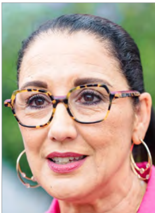
Fadila Khattabi Ministre déléguée chargée des Personnes handicapées